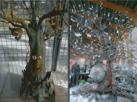
...des œuvres exceptionnelles à découvrir