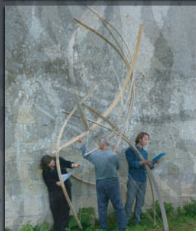
sculptures, installations en tout genre...